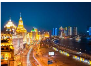
Xi'an 📍 ✈️ 1380km - ⌚ 2h 15m Shanghai 📍