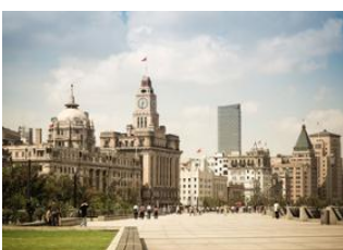
Shanghai 📍 🚗 - ⌚ 1h Zhujiajiao 📍 🚗 - ⌚ 1h Shanghai 📍