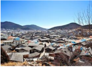
Lijiang 📍 🚗 180km - ⌚ 4h Shangri-la 📍