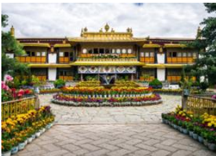
Shangri-la 📍 ✈️ - ⌚ 2h 10m Lhasa 📍