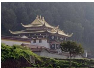
Village de Langmusi