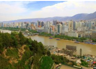
Xiahe 📍 🚗 Lanzhou 📍