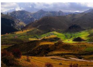
Village de Langmusi