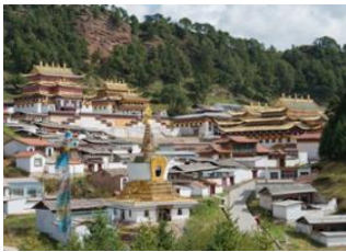
Tongren 🚗 - ⌚ 5h Village de Langmusi