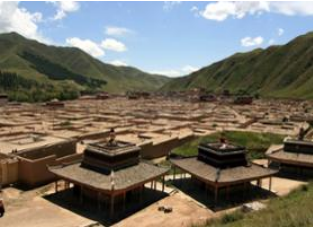
Village de Langmusi 📍 🚗 - ⌚ 3h 30m Xiahe 📍