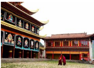
Village de Langmusi