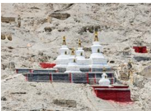
Shigatse 📍 🚗 235km - ⌚ 4h 40m Sakya (3800m) 📍 🚗 150km - ⌚ 2h 50m Shigatse 📍