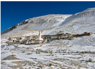
Shigatse 📍 🚗 335km - ⌚ 6h Rongbuk 📍